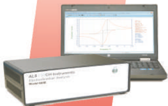
二次電池 蓄電技術開発