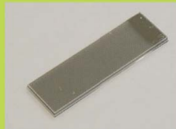
Ptグリッド電極(別売) 他材質グリッドやITOもあります。